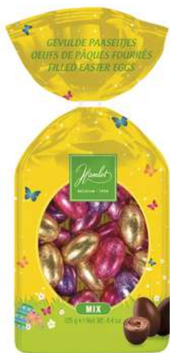
Paaseitjes Melk en Puur 125 gram

Heerlijke paaseitjes van Tony's Chocolonely, assortiment