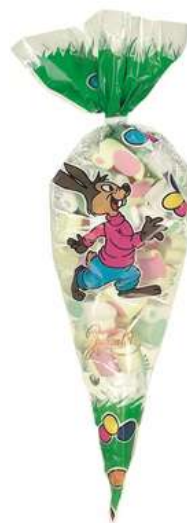
Paasspekken puntzak 250 gram