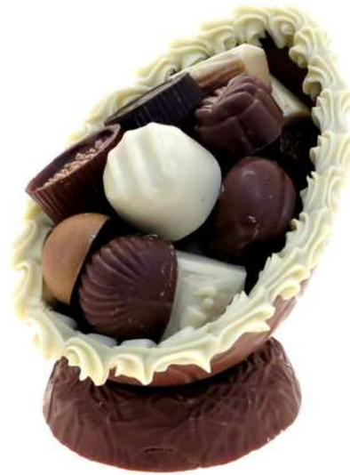
Luxe paasei wit, 350 gram

Paasei Musket chocolade eitjes op chocolade nest, 350 gram.