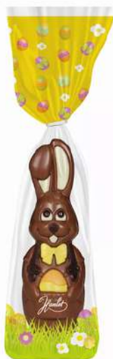
Paashaas 'Buddy' 125 gram