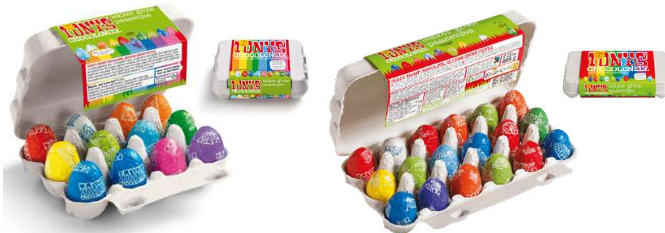
Tony's Chocolonely Paaseitjes 225 gram

Heerlijke paaseitjes van Tony's Chocolonely, assortiment