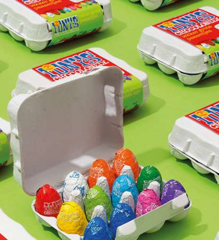
Tony's Chocolonely Paaseitjes 150 gram

Heerlijke paaseitjes van Tony's Chocolonely, assortiment