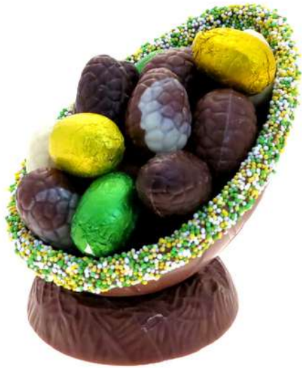
Paasei musket, 350 gram

Paasei Musket chocolade eitjes op chocolade nest, 350 gram.