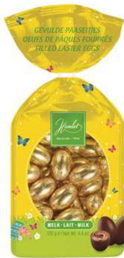
Paaseitjes melk praliné 125 gram