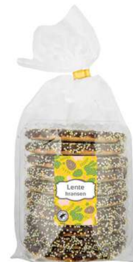
Lentekransen, 410 gram