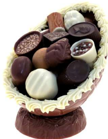
Luxe paasei wit, 500 gram

Paasei Musket chocolade eitjes op chocolade nest, 450 gram.