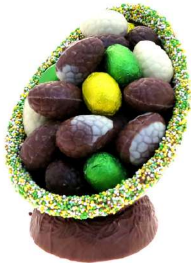
Paasei musket, 450 gram

Paasei Musket chocolade eitjes op chocolade nest, 450 gram.